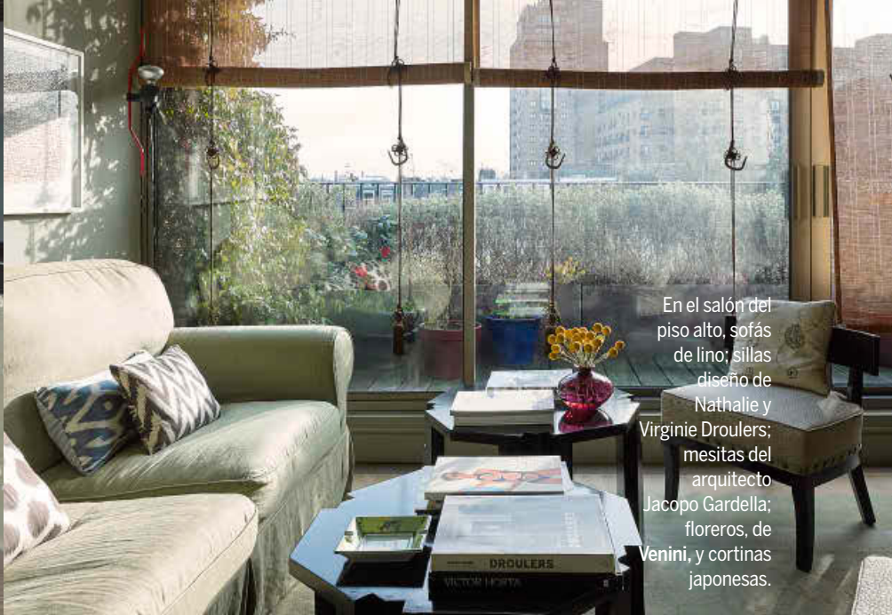
En el salón del piso alto, sofás de lino; sillas diseño de Nathalie y Virginie Droulers; mesitas del arquitecto Jacopo Gardella; floreros, de Venini, y cortinas japonesas.

manteles de Irán, coloridos tejidos de la India, cojines de Estambul y objetos únicos de Japón.