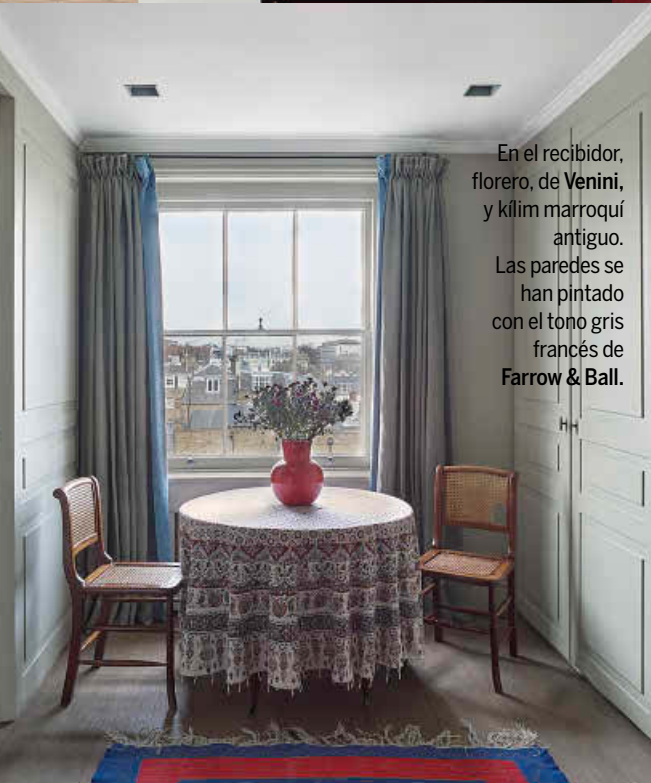
En el recibidor, florero, de Venini, y kilim marroquí antiguo. Las paredes se han pintado con el tono gris francés de Farrow & Ball.