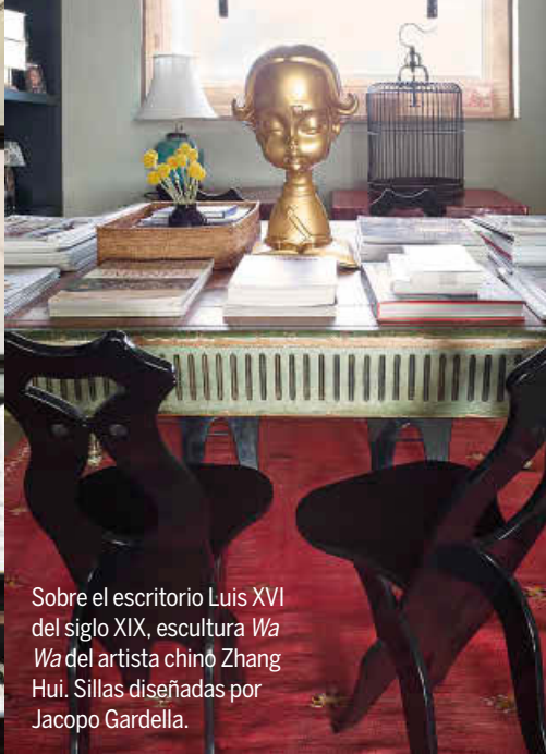
Sobre el escritorio Luis XVI del siglo XIX, escultura Wa Wa del artista chino Zhang Hui. Sillas diseñadas por Jacopo Gardella.