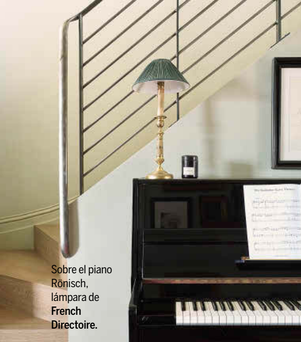
Sobre el piano Rönisch, lámpara de French Directoire.