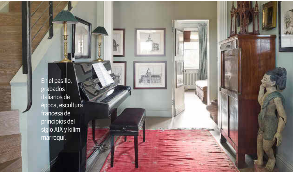
En el pasillo, grabados italianos de época, escultura francesa de principios del siglo XIX y kilim marroquí.