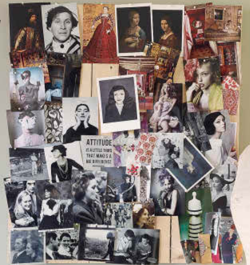
Maniquí y moodboard de Morpho + Luna, la marca de ropa de dormir de Cécile Gavazzi.