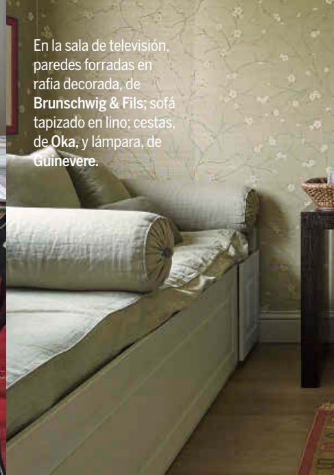
En la sala de televisión, paredes forradas en rafia decorada, de Brunschwig & Fils; sofá tapizado en lino; cestas, de Oka, y lámpara, de Guinevere.